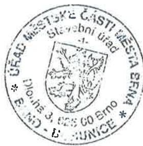
„otisk úředního razítka“